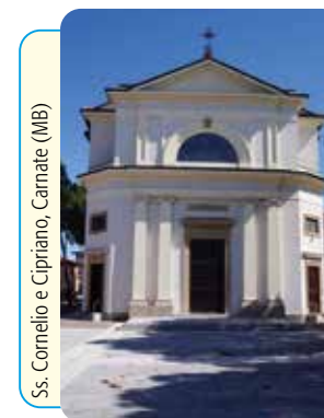
Ss. Cornelio e Cipriano, Camate (MI)

Via B. Crespi, 30 - 20159 Milano - Tel. 02.345608.1 - Fax 02.345608.36 - Distr. Libreria Ancora Via Larga, 7 - 20122 Milano - Tel. 02.5830.7006 - abbonamenti@ancoralibri.it LA MESSA FESTIVA DEI FEDELI - Settimanale liturgico - N. 21 - Anno 35 - Direttore Responsabile G. Zini - Trib. Milano n. 344 del 6-7-1985 - Prezzo € 0,041 - Stampato su carta riciclata. Imprimatur: in Curia Arch. Mediolani die 4-11-2019, B. Marinoni Vic. ep.